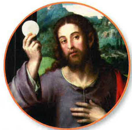
La Última Cena (detalle), Vicente Juan Micap, siglo XVI.

Las 14 Estaciones de la Cruz representan los acontecimientos de la Pasión de Jesús. Nos detenemos en cada estación para reflexionar en lo que Jesús estaba padeciendo. Rezando le damos las gracias a Jesús por todo lo que hizo por nosotros. Le pedimos la fuerza y el valor para vivir nuestra vida como sus seguidores.