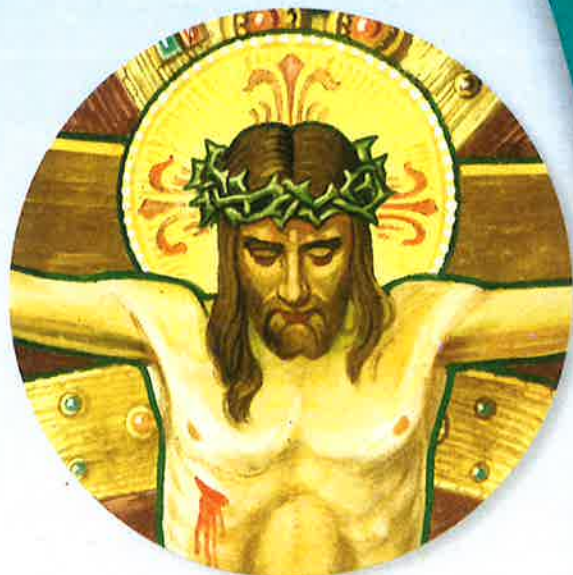
Church fresco of Jesus (detail), Tilburg, Holland

Jesus loved us so much he gave his life for us. Do something selfless for someone you love, such as offering to help them instead of playing games.