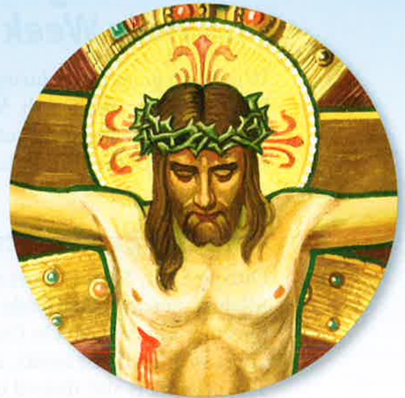
Detalle de una pintura de Jesús en una iglesia de Tilburg, Holanda

La Cuaresma y la Semana Santa son un tiempo para recordar la Pasión de Jesús. Reflexionamos solemnemente sobre el sufrimiento y la Crucifixión de Jesús. La Veneración de la Cruz, parte de la liturgia del Viernes Santo, simboliza nuestra reverencia por el máximo sacrificio que hizo Jesús y nuestro reconocimiento de que la cruz es también nuestro camino a la Salvación.