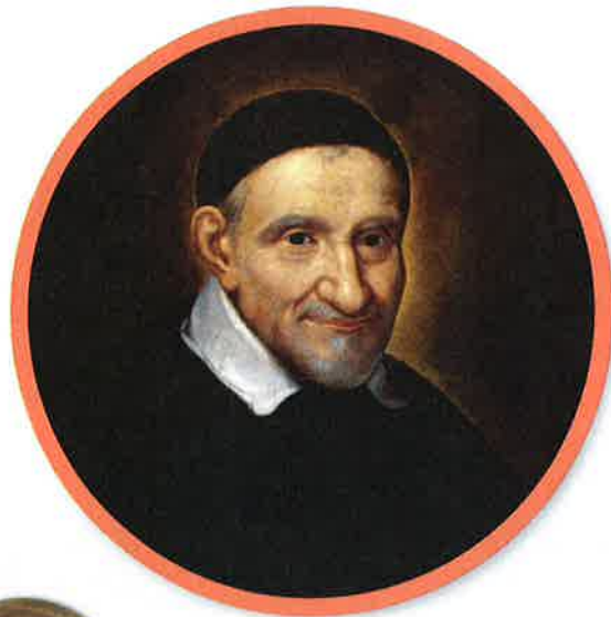
San Vicente de Paúl