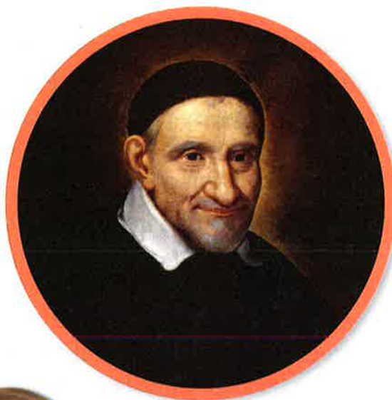
Saint Vincent de Paul

Vincent put Louise in charge of a new order of women, the Sisters of Charity. Louise decided this religious order would actively serve people in need. She and her community spent their lives working in homes, orphanages, hospitals, and schools. Today the Sisters of Charity of St. Vincent de Paul continue to serve people in need all over the world. March 15 is the feast of Saint Louise de Marillac.