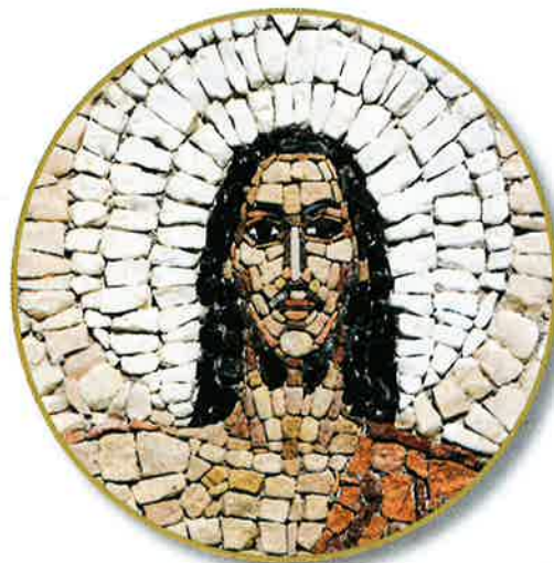
Stone mosaic of the resurrected Jesus

When you look around your church during the Easter season, you'll notice white altar linens and vestments, white Easter lilies, and bouquets of spring flowers decorating the sanctuary. The blooms are symbols of new life. White, the season's liturgical color, represents joy and victory. The color, beauty, and joy that fill your church during the Easter season celebrate the risen Christ.