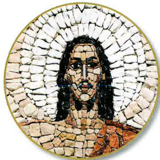
Mosaico de piedra de Jesús resucitado

Cuando mires a tu alrededor en tu iglesia durante el tiempo litúrgico de la Pascua de Resurrección, fíjate en las telas del altar y las vestiduras blancas, los lirios blancos de Pascua y los ramos de flores primaverales que decoran el santuario. Las flores son símbolos de nueva vida. El blanco, el color de este tiempo litúrgico, representa alegría y victoria. El color, la belleza y la alegría que colman tu iglesia durante el tiempo litúrgico de la Pascua celebran a Cristo resucitado.